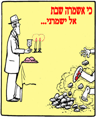
כי אשמרה שבת אל ישמרני...

לחיות הוא אחד הדברים הנדירים ביותר, רוב האנשים פשוט קיימים